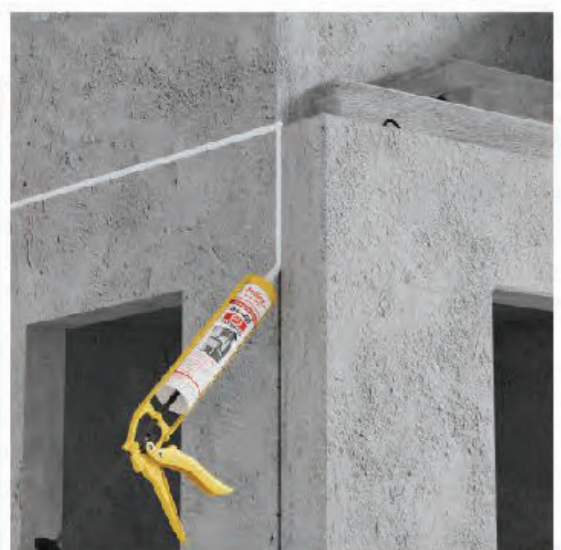
รอยต่อผนังพรีคาสท์