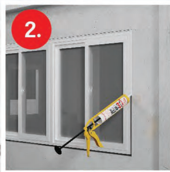
2. ยิงยาแนวซิลรอยต่อ