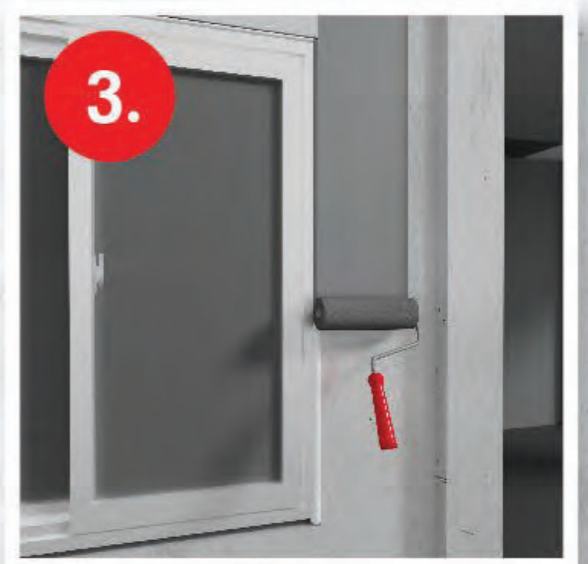
3. ทาสีทับได้ ไม่ต้องรองพื้น