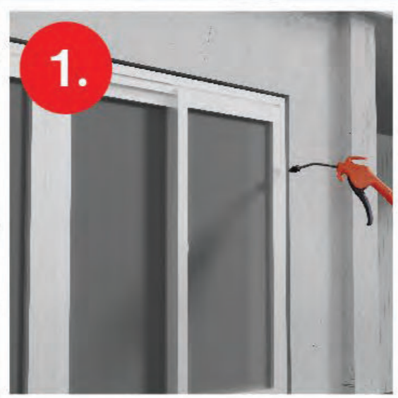
1. ทำความสะอาดพื้นผิว