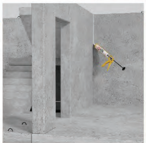
รอยต่อผนังภายใน