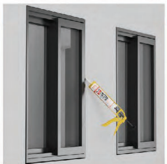
ซิลรอยต่อกรอบหน้าต่าง