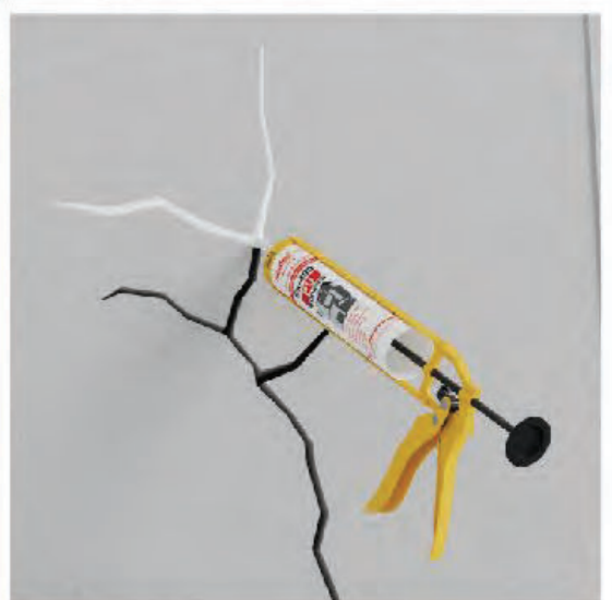
ซ่อมรอยแตกร้าว