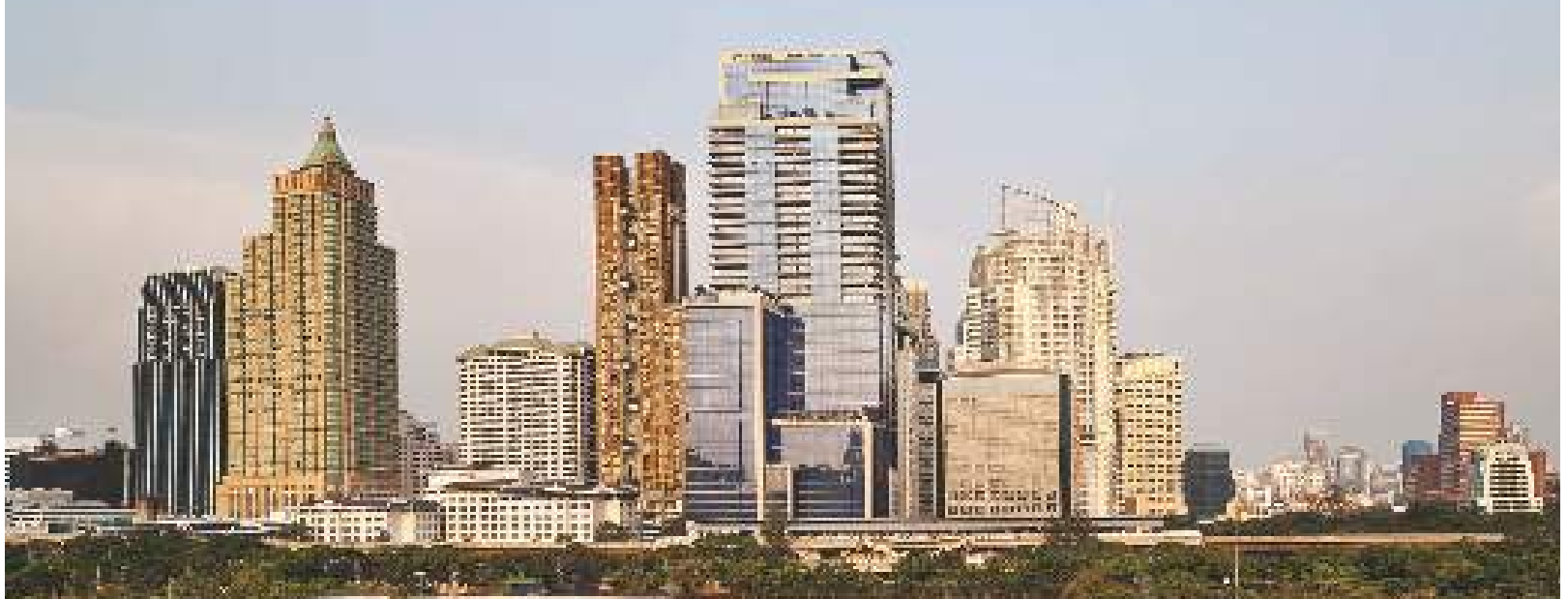
โรงแรม The St. Regis Bangkok ใช้ฉนวน ROCKWOOL สำหรับงานระบบผนังกันห้อง

เพราะ ROCKWOOL คือผู้ผลิตฉนวนสโตนวูลรายใหญ่ที่สุดในโลก